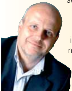
Maurizio Marello Sindaco di Alba

Ad inizio anno sottoporro al Consiglio comunale l'approvazione definitiva del nuovo Piano regolatore, un documento fondamentale per lo sviluppo della città, che ci ha molto impegnati e che tocca da vicino tutti i cittadini. Un altro motivo di orgoglio. Per ultimo - ma è la cosa più importante - faccio a tutti gli albesi, donne e uomini, grandi e piccoli, i miei più vivi auguri per le imminenti festività. Nel momento della gioia e dell'allegria, ricordiamoci sempre anche di chi è in difficoltà ed ha bisogno di aiuti. Così so che già fanno tantissimi di voi, così intende fare anche l'Amministrazione.