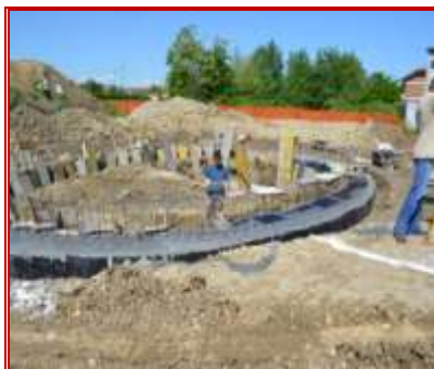
Sala del commiato